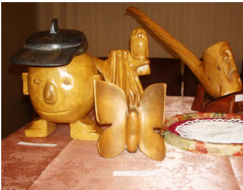
Работы незрячих мастеров.

Но в более старшем важно создать мотивацию, вызвать интерес у изучающих. Конечно, выезд за границу, где может понадобиться язык, проблематичен для этих людей, но при изучении компьютерных технологий английский сыграет важную роль. «Более того, появится возможность прочтения любимых книг в оригинале – это иное восприятие литературы, – говорит преподаватель. – То же самое и при просмотре фильмов в оригинале – совсем иной смысл. Так и можно мотивировать. Я считаю, что проект поможет этим людям самоутвердиться. Изучение любого языка развивает мышление, память, внимание. Им будет легче в быту. А общение с внуками? Если мой ученик покажет, что знает что-то на английском языке – общение с молодым поколением будет абсолютно другое. Но скрывать не буду, мотивация всё же ниже, чем у студентов, к примеру, и это объяснимо – болезнь и диагноз порой сложно преозмочь».