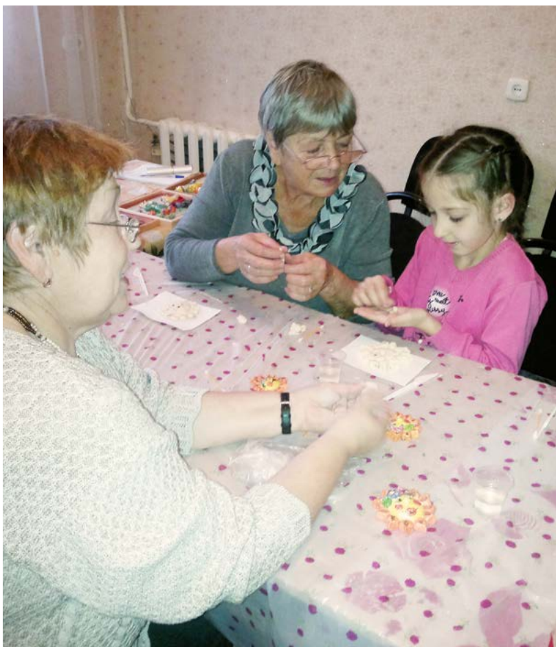
Занятия по тестопластике пришлись по душе и старшему поколению, и их внукам.

ную воду, а не мазать маслом, к примеру. Слушателей курса мы научили, например, делать сердечно-лёгочную реанимацию. В целом курс оказался полезным».