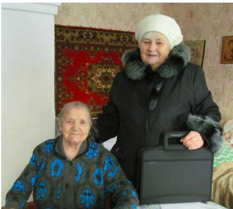
Проект: «Социальный курьер»

Опрос населения о доступности информации по социальному обслуживанию