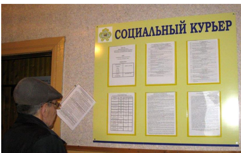
Информационный стенд «Социальный курьер» в д. Матвеево

Опрос населения о доступности информации по социальному обслуживанию