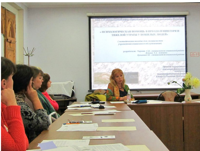
Практико-ориентированный семинар с педагогами психологами и социальными педагогами школ города. Презентация методического руководства

Было подготовлено пять фасилитаторов для дальнейшей работы по организации групп самопомощи и пять доброволь-