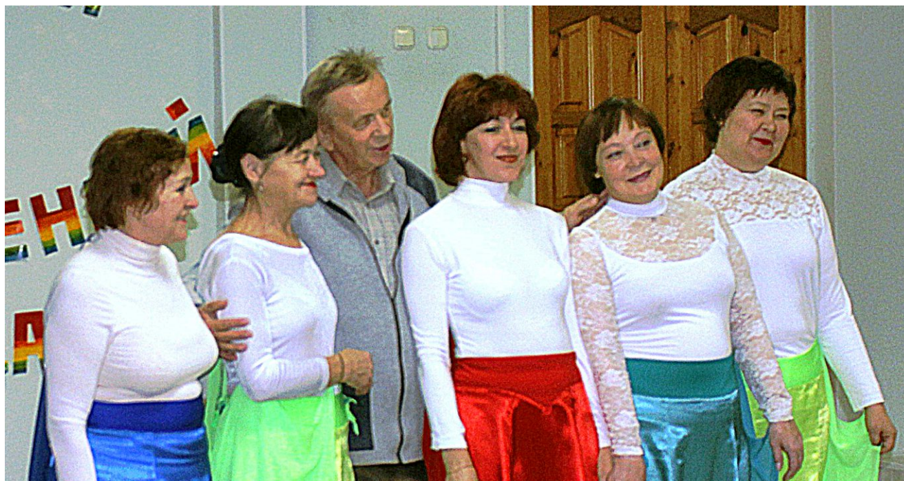
Танцевальный коллектив «Карнавал»

Пенсионеры и воспитанники Центра занимались не только театральной деятельностью. 22 октября в клубе «Ветеран» ОАО «Северсталь» состоялся концерт, посвященный Дню пожилого