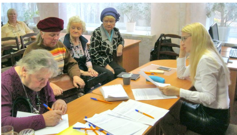
Открытые лекции и очные юридические консультации для пожилых людей

Проект: «Юридическая помощь как социальная технология повышения качества жизни пожилых людей»