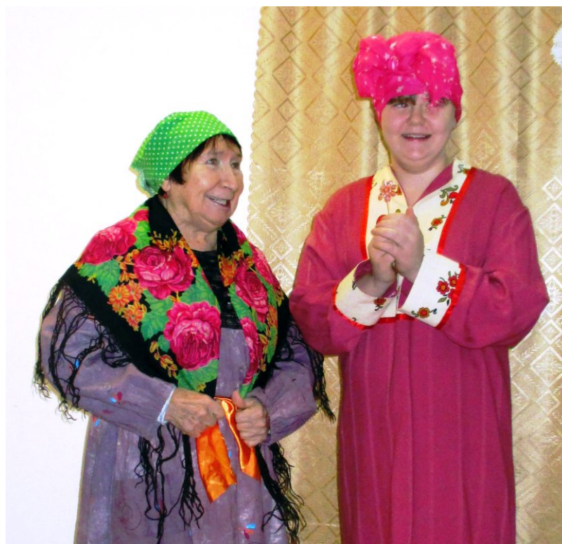
Весёлая мачеха с дочкой

Проект: «Театральная студия «Неунывай-ка»