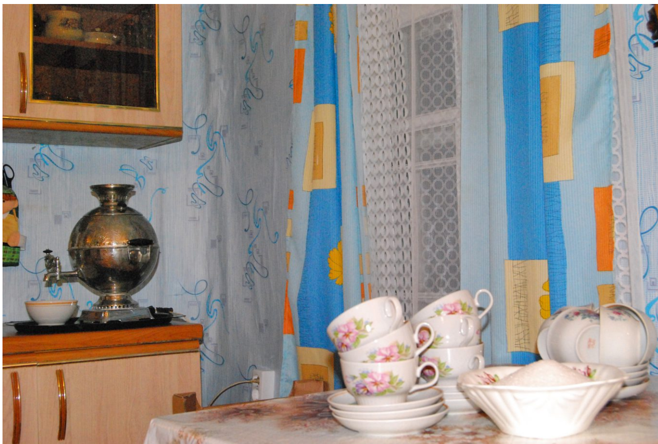
Интерьер общего дома