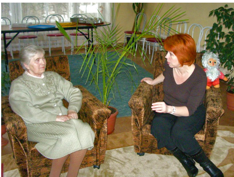
На консультации у психолога

Членами группы самопомощи стали 20 добровольных помощников из числа пенсионеров - они приняли участие в организации опроса по выявлению пожилых граждан, находящихся в состоянии горя. В результате практически все участники пришли к пониманию того, что людям, потерявшим близких, можно помочь.