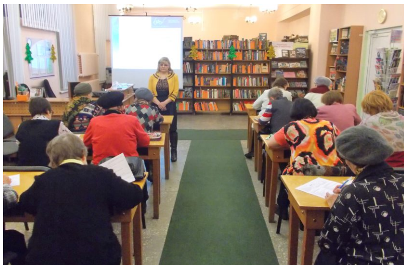
Скрининг-обследование лиц пожилого возраста

В ближайшее время планируется продолжить тестирование пожилых людей с охватом аудитории разных социальных групп с последующей обработкой результатов.