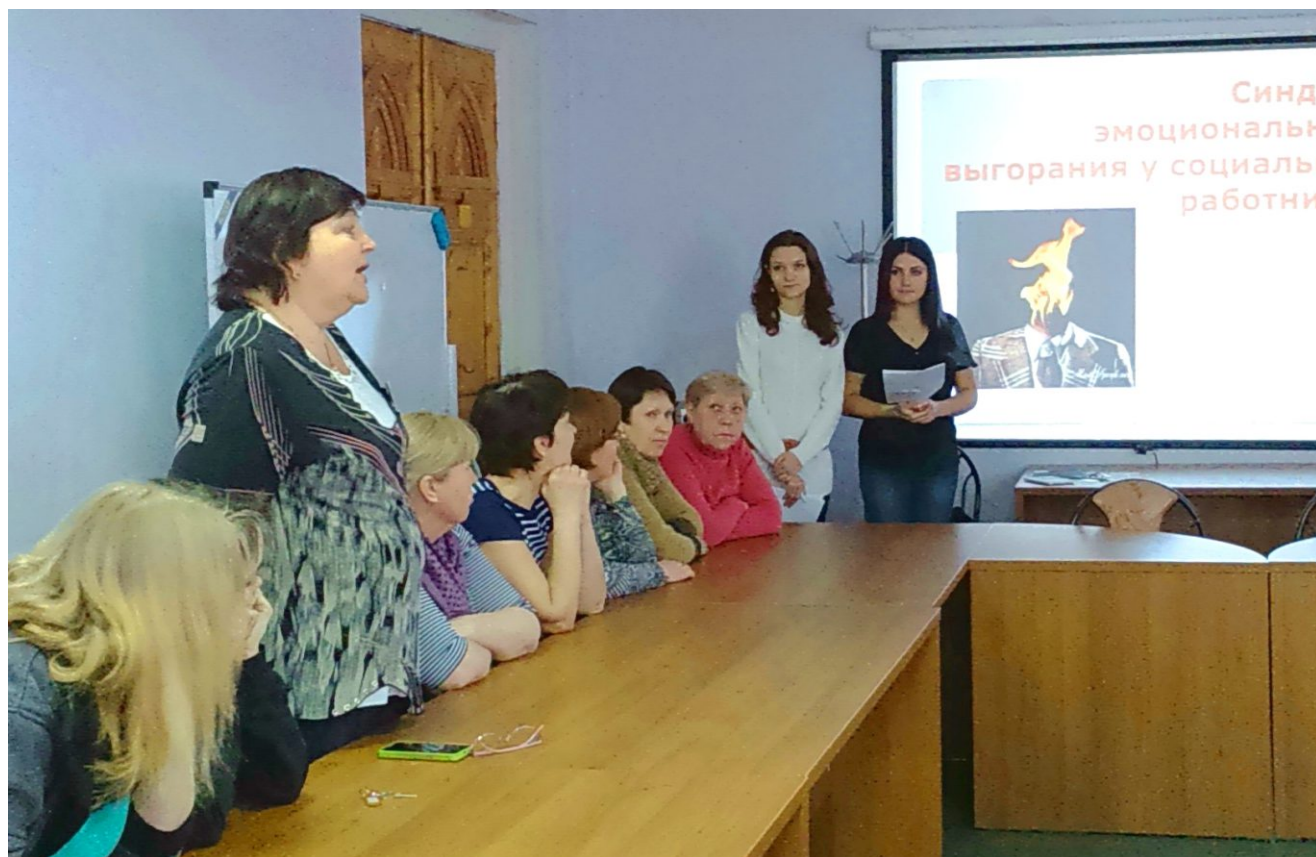
Занятие в группе самопомощи

Значительное внимание уделялось информационно-образовательной деятельности. В информационно-образовательную акцию были вовлечены 988 человек. К участию в проекте были привлечены 44 человека, вместо заявленных по плану 30-ти. Стали членами группы самопомощи 20 добровольных помощников из числа пенсионеров - они приняли участие в организации опроса по выявлению пожилых граждан, находящихся в состоянии горя.