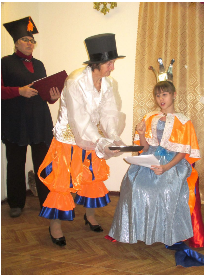
Выездной спектакль в Дом ветеранов

Сейчас мы планируем показать спектакль «12 месяцев» в детских садах и библиотеках города.