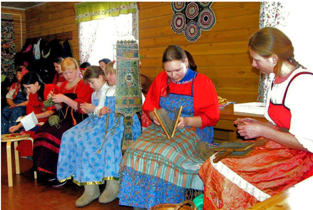
Уроки «бабушкиных премудростей»