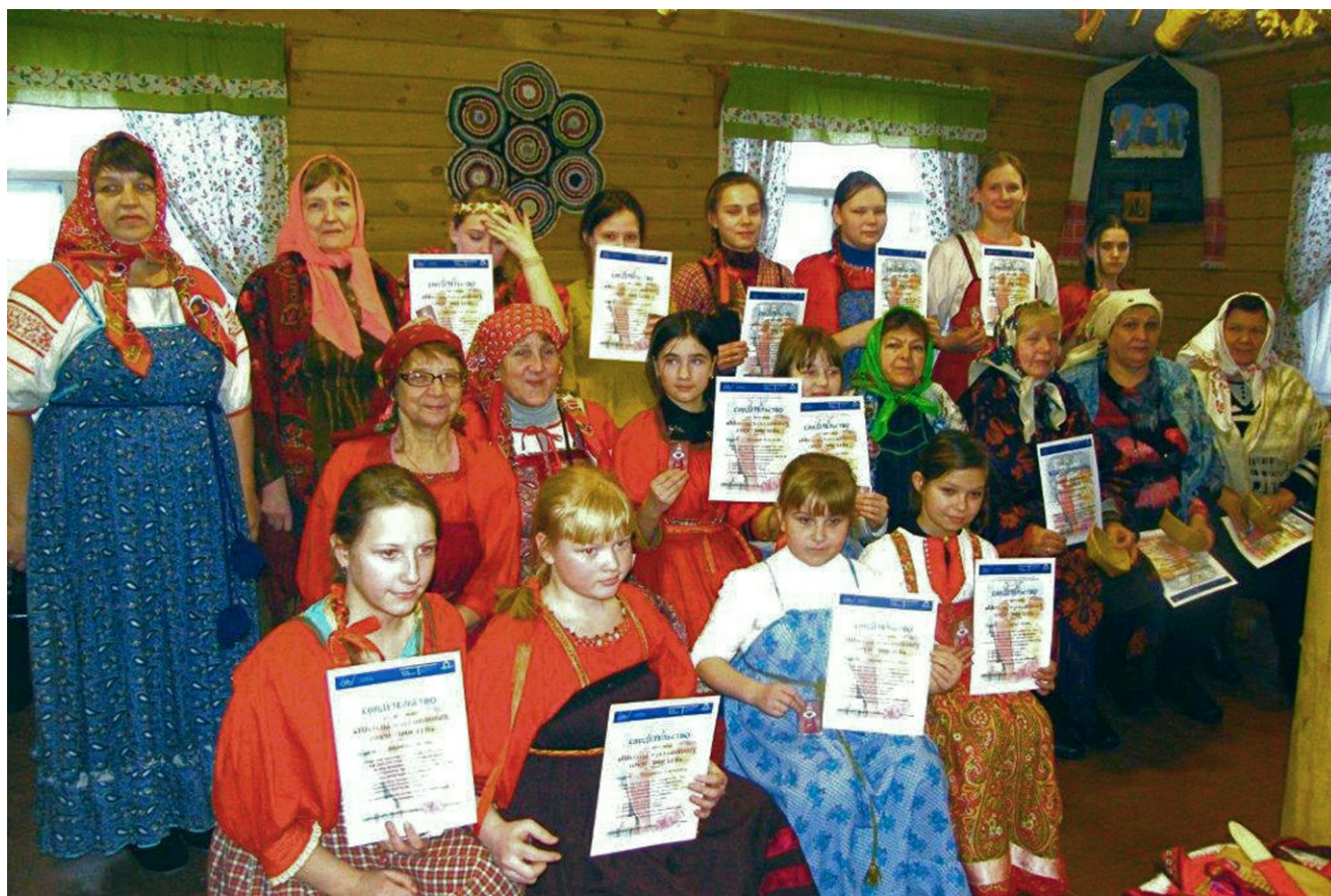
«Большухи» и «славутницы»

суд не только своих наставниц, но и гостей из Каргополя. Как и ожидалось, знания оказались крепкими, а «славутницы» (так называли на Каргопольщине девушек на выданье, которых надо хвалить да славить) – достойными хранительницами местных традиций.