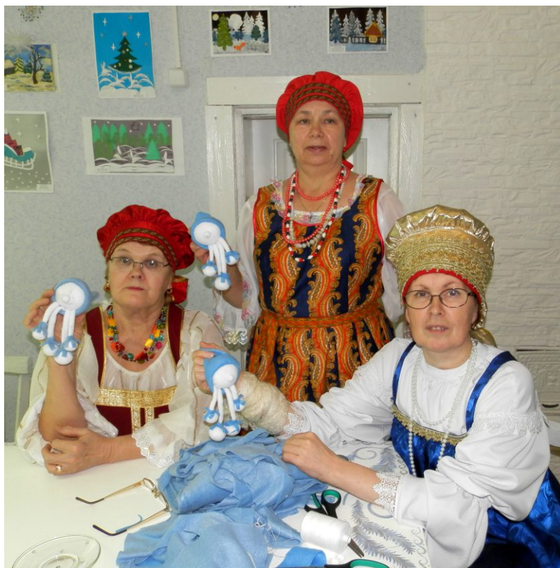
У каждой мастерицы свой Снежик

Мастерская продолжила свою работу и по завершении проекта. Мы даже не ожидали, что будет столько желающих шить «снежики». В лавке мастеров в «Резиденции Матушки Зимы» даже образовался запас столь популярных сувениров.