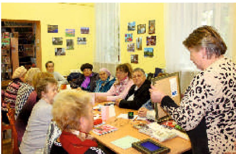
Проект «Заново откроем мир»

В итоге научились: оказывать первую медицинскую помощь в быту, подбирать физические нагрузки на танцах, дружно посетили концерт Академического хора и посмотрели концерт Хора ветеранов «Надежда», получили информацию о предоставлении субсидий по оплате ЖКУ, перерасчёте пенсий по страховым периодам, ответили на вопросы по медицине, образованию, благоустройстве, местному самоуправлению, ЖКХ города.