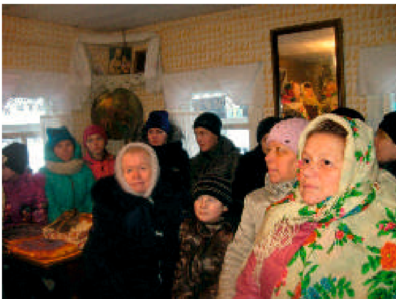
В «Музее народного быта»

Присматривает за музеем Администрация Занюхчи и жители деревни.