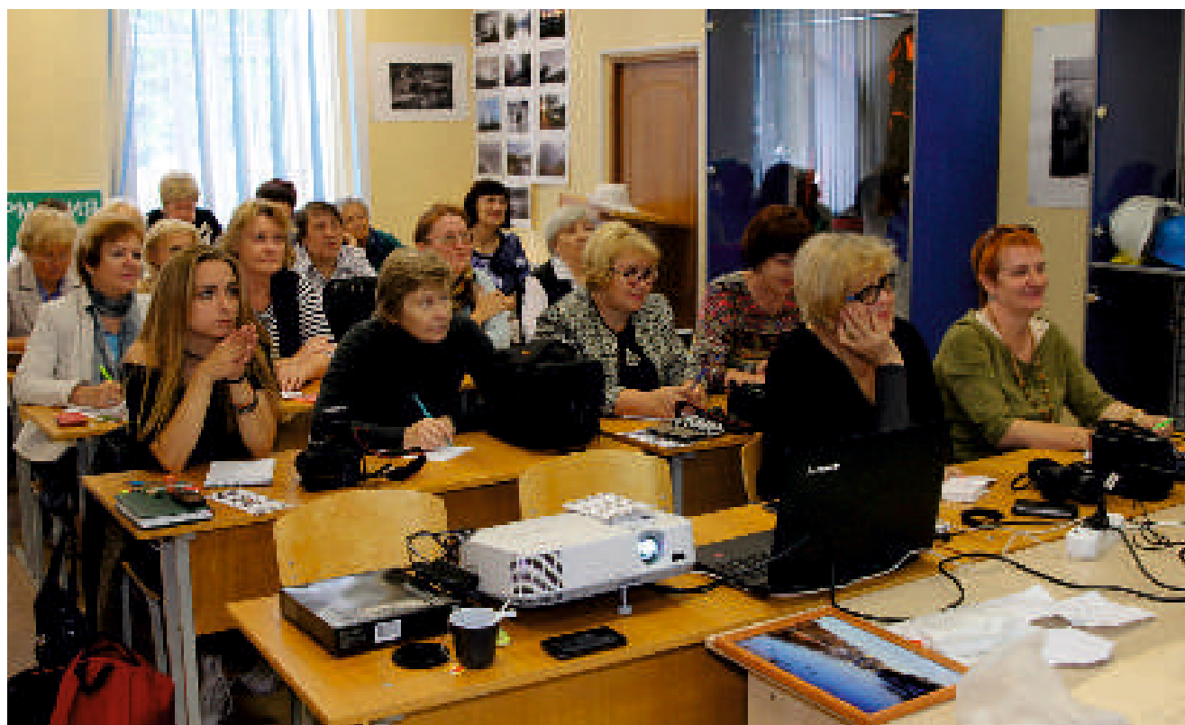
Фото клуб Контраст, Лекция №1