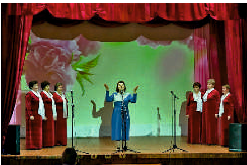
Проект «В этой деревне огни не погашены»