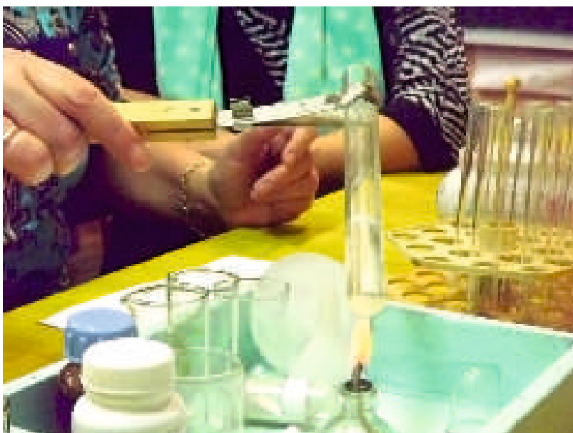
Проект «Гори, «Огонек»

экран. Малая Слобода — под Мезенью, а сама Мезень — довольно далеко от столицы Поморья, к тому же, «за интернетом», чтобы выбрать и заказать проектор, пришлось ходить в Администрацию. Но все сложилось. Люди помогли.